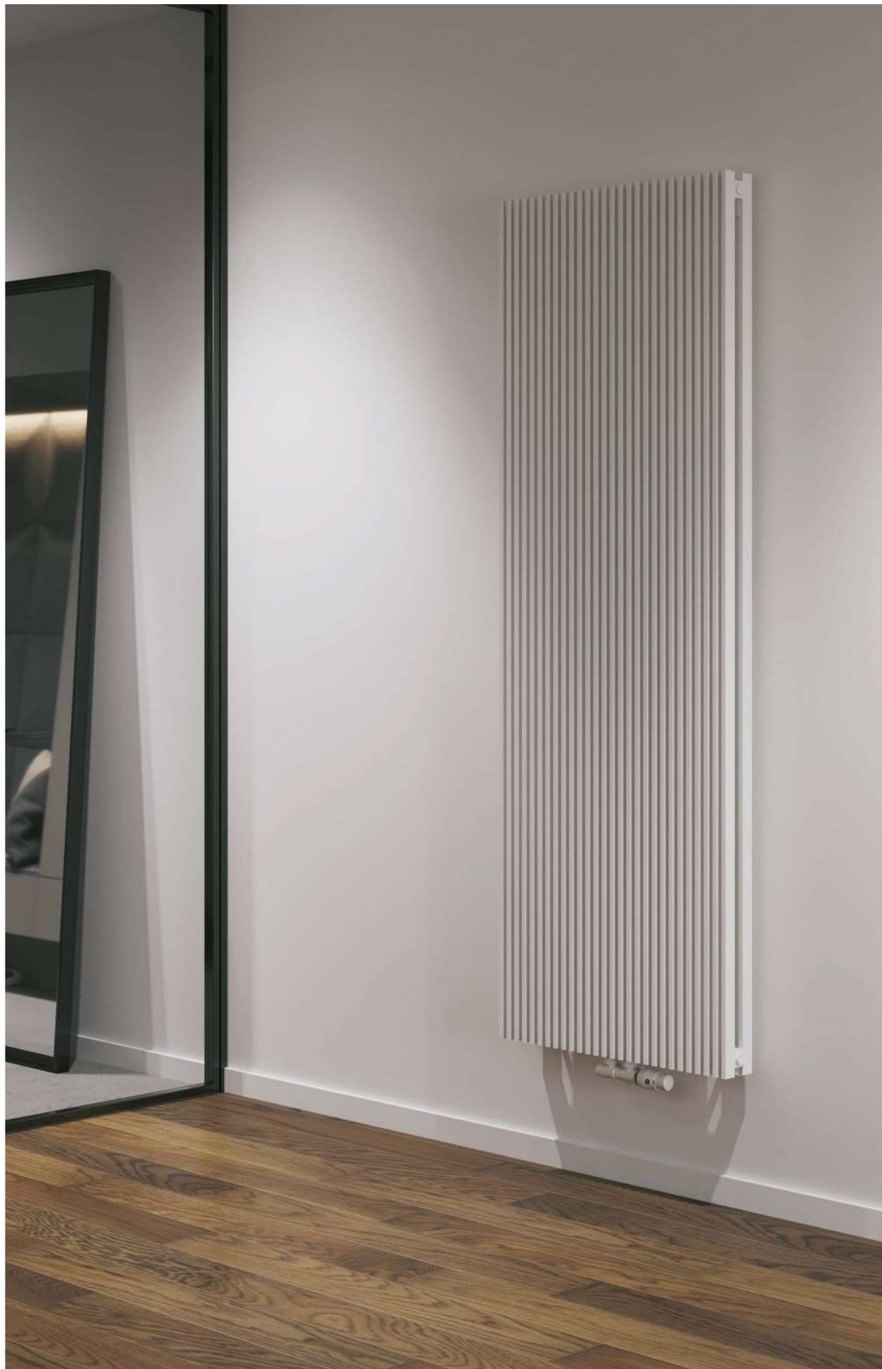
Na aranżacji: grzejnik c.o. AFRN2 -180/28, zestaw zaworowy Z15 In the visualisation: AFRN2 -180/28 heating radiator and Z15 valve set